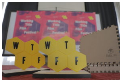
( http://www.venetoeconomia.it/wp-content/uploads/2017/04/E02A6091-copia.jpg )