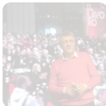
Maurizio Landini chiude il XVIII Congresso nazionale della Cgil - Bari, 25 gennaio...