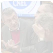
Cnel, presentazione libro 'Le riforme dimezzate'. Roma, 29 gennaio 2019