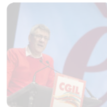
Maurizio Landini: siamo il sindacato del cambiamento. Primo discorso nuovo segretario...