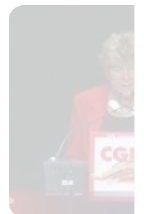
Il saluto di S Camusso: P nel futuro il quadrato rosso Bari, 25 gen