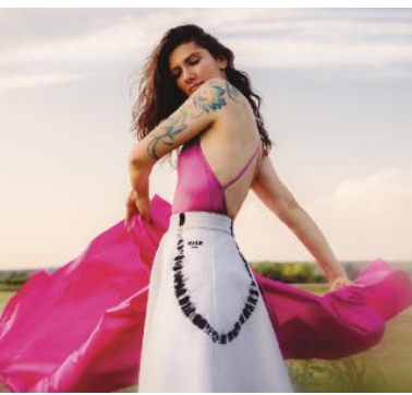
Elisa Toffoli, in arte Elisa, classe 1977, è nata a Trieste

Dieci album, 13 dischi di platino, tanti tour e prestigiose collaborazioni. Salta alla ribalta con la vittoria al Festival di Sanremo nel 2001 con la splendida Luce (tramonti a nord est) . Elisa è oggi una delle artiste italiane più ap-